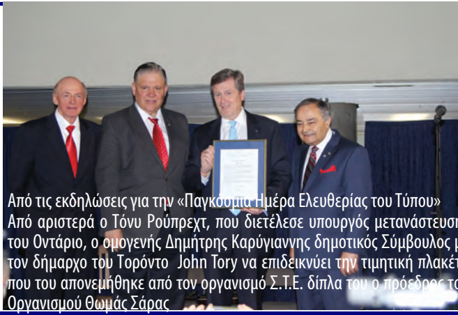
Από τις εκδηλώσεις για την «Παγκόσμια Ημέρα Ελευθερίας του Τύπου» Από αριστερά ο Τόνυ Ρούμπρεχτ, που διετέλεσε υπουργός μεταναστευσης του Οντάριο, ο ομογενής Δημήτρης Καρύγιαννης δημοτικός Σύμβουλος με τον δήμαρχο του Τορόντο John Tory να επιδεικνύει την τιμητική πλακέτα που του απονεμήθηκε από τον οργανισμό Σ.Τ.Ε. δίπλα του ο πρόεδρος του Οργανισμού Θωμάς Σάρας