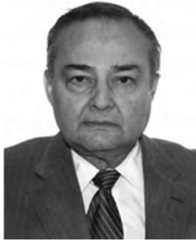
Του Θωμά Στεφ. Σάρα

Δεν ήταν λίγοι εκείνοι που χαμογέλασαν ειρωνικά με την σχετική μας αρθρογραφία εδώ και μια πενταετία, καθώς αναφερόμασταν στις πιθανότητες μιας νέας πολυεθνικής σύρραξης στην Μέση Ανατολή.