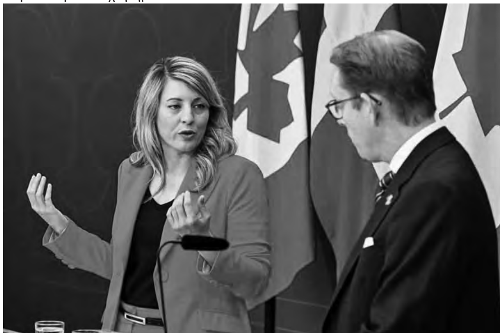
Η υπουργός Εξωτερικών Mélanie Joly, αριστερά, και ο Σουηδός ομόλογός της Tobias Billström πραγματοποιούν κοινή συνέντευξη Τύπου στη Στοκχόλμη της Σουηδίας

«Είναι το βούτυρο πριν από τα όπλα», είπε, αναφερόμενος στο πανάρχαιο πολιτικό ρητό που περιγράφει μια σχέση είτε-ή είτε μεταξύ της άμυνας και των κοινωνικών δαπανών. «Δεν είμαι σίγουρος ότι η πολιτική της κυβέρνησης θα ήταν ριζικά διαφορετική εάν η κυβέρνηση άλλαζε. Δεν έχετε ακούσει τον [Συντηρητικό Ηγέτη] Πιερ Πολιέβ να δεσμεύεται να κάνει δύο τοις εκατό», είπε. «Μπορεί να έχουν πιο δυνατά λόγια, όπως κάνουν γενικά οι Συντηρητικοί. Και όπως γνωρίζουμε, τα αρχεία των Συντηρητικών μερικές φορές υπολείπονται.»