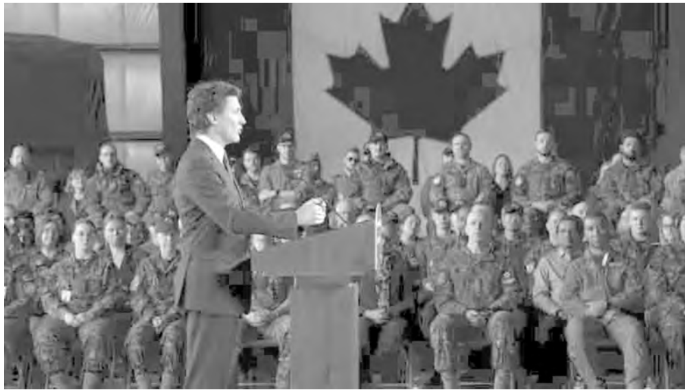
Ο πρωθυπουργός Τζάστιν Τριντό μιλάει κατά τη διάρκεια συνέντευξης Τύπου για τη νέα αμυντική πολιτική του Καναδά στο CFB Trenton στο Trenton, Ont. τ

κατά της σκληρής ισχύος δεν είναι κάτι που έχει συζητηθεί ευρέως στη συχνά κυκλική συζήτηση σχετικά με τις προσδοκίες του NATO από τα κράτη μέλη. Χωρίς αμφιβολία, οι περισσότερες κυβερνήσεις - ανεξάρτητα από την πολιτική τους λωρίδα - θα προτιμούσαν να ξοδεύουν χρήματα σε κάτι άλλο εκτός από την άμυνα. Αλλά το γεγονός παραμένει ότι τις επτάμισι δεκαετίες από τη δημιουργία του NATO, οι αμυντικές δαπάνες των συμμάχων του NATO έτειναν να αυξάνονται σε περιόδους αυξανόμενων διεθνών εντάσεων και να πέφτουν σε καλύτερες εποχές.