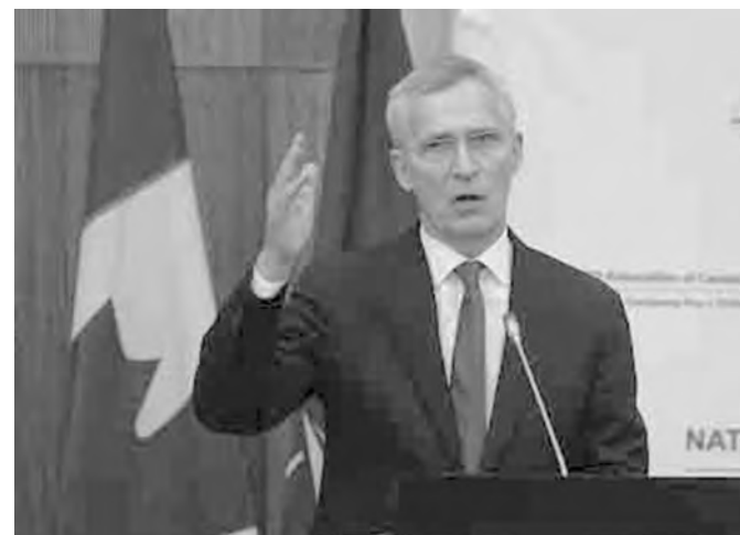
Λεζάντα: Ο υπουργός Εθνικής Άμυνας Μπιλ Μπλερ