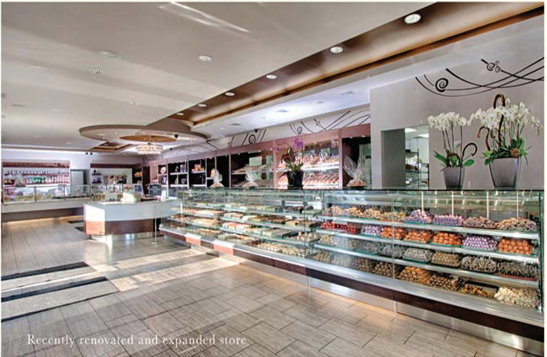
Recently renovated and expanded store