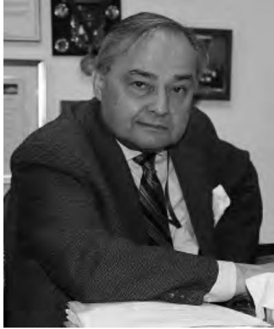
Του Θωμά Σ. Σάρας

Μέσα από τις φωνασκίες και τους αλαλαγμούς περηφάνιας των εορτασμών της Βόρειο-Ατλαντικής συμμαχίας (NATO), και τις μεγαλόστομες διακηρύξεις περί ελευθερίας, δημοκρατίας και συναδέλφωσης των λαών, μέσα στα πλαίσια του σεβασμού της εθνικής κυριαρχίας και των γεωγραφικών συνόρων των μελών του οργανισμού και όχι μόνον, καλύφθηκαν οι αναστεναγμοί και ο πόνος των κυπρίων προσφύγων, μέσα στην ίδια τους την πατρογονική γη.