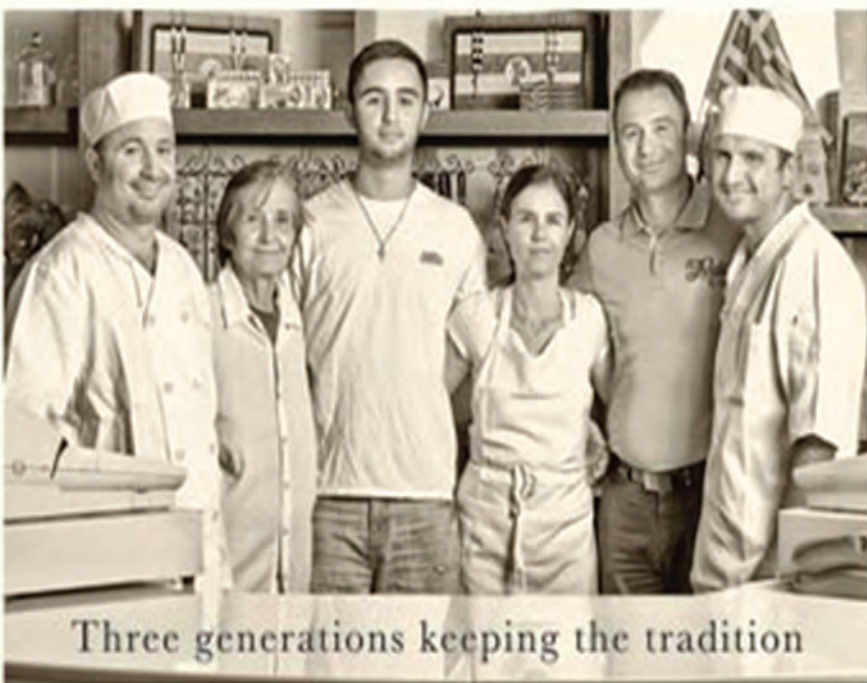
Three generations keeping the tradition